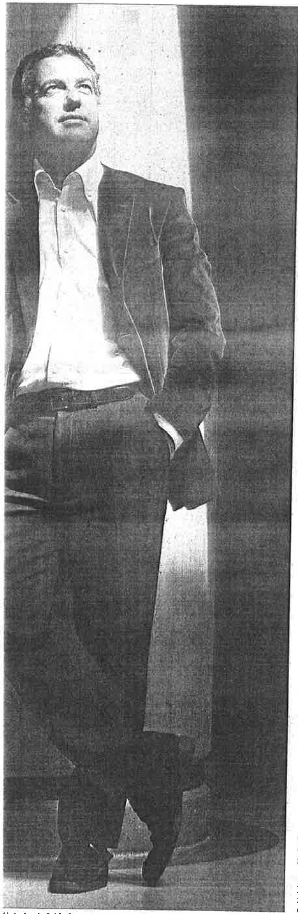
Interior de Sabin Etxea, la sede del partido, en la capital vizcaína. / IÑAKI ANDRÉS

que se trata de cuestiones meramente personales?