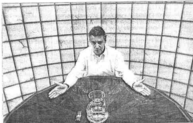
El presidente del PNV durante la entrevista en su despacho en Sabin Etxea.

«¿Tocado? No, Xabier Agirre ha salido fortalecido por la imagen de contundencia y transparencia que ha dado ante la sociedad alavesa»